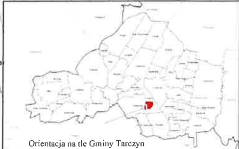
Orientacja na tle Gminy Tarczyn